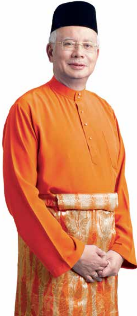
YAB Dato' Sri Mohd Najib Tun Haji Abdul Razak Perdana Menteri dan Menteri Kewangan Malaysia